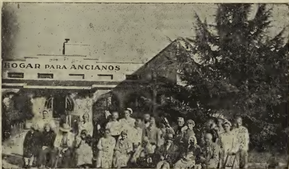
Hogar para Ancianos de Colonia Valdense

¿Qué sentimientos experimentamos frente al mendigo que golpea a la puerta de nuestra casa? ¿Qué actitud asumimos frente a los vagabundos que andan por allí sin hogar? ¿Qué contestación damos a los que nos piden una contribución para una obra de